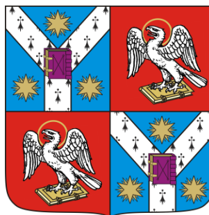
FACULTATEA DE LITERE